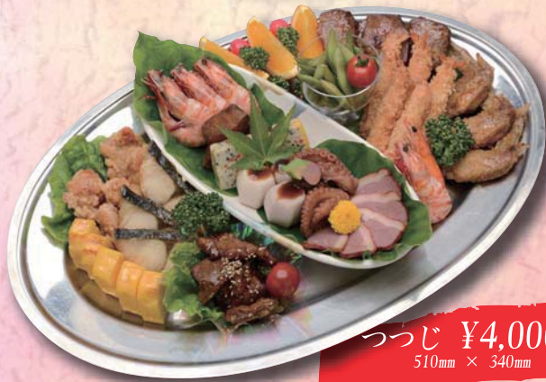
つつじ ¥4,000- 510mm × 340mm