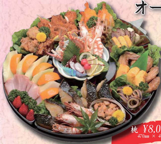
桃 ¥8,000- 470mm × 470mm