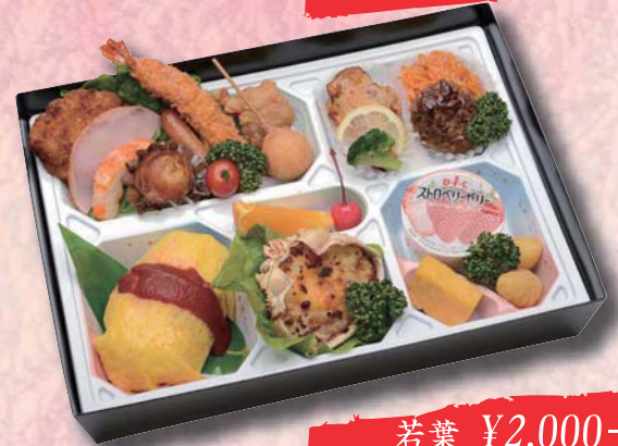
若葉 ¥2,000- 340mm × 245mm

フリーダイヤル ※価格については税別となっています。(別途消費税をお預かり致します。)