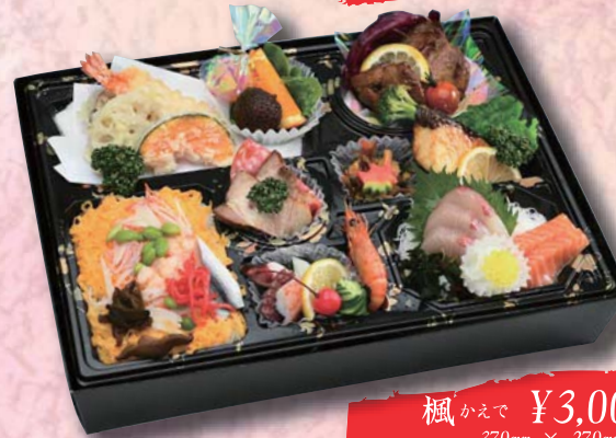
楓 かえで ¥3,000- 370mm × 270mm