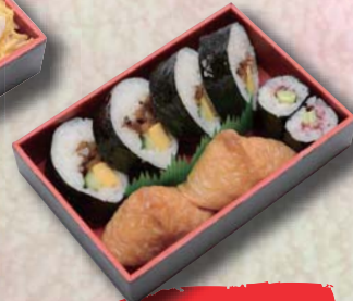
助六寿司 ¥500- 170mm × 115mm