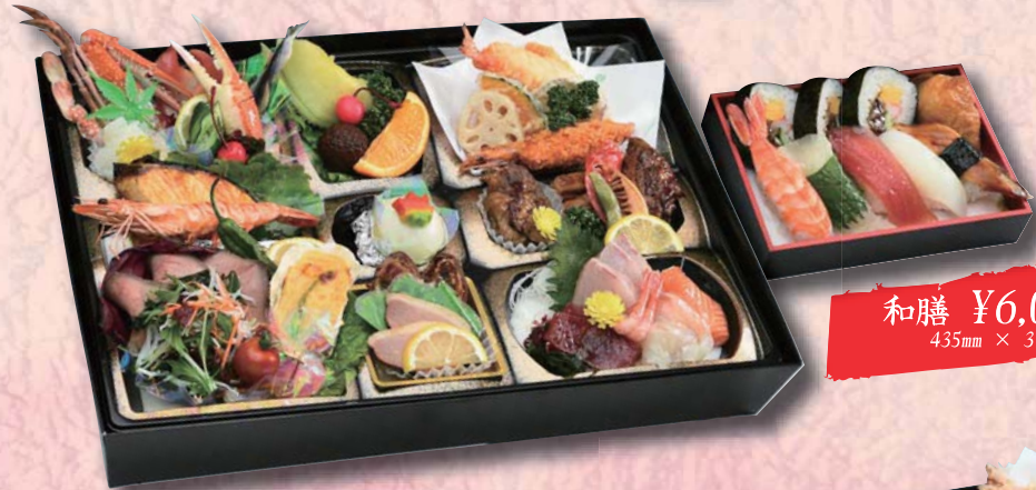
和膳 ¥6,000- 435mm × 310mm