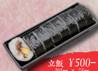
立飯 ¥500- 205mm × 75mm