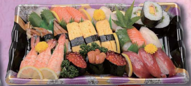
藤 ¥3,000- 380mm × 220mm