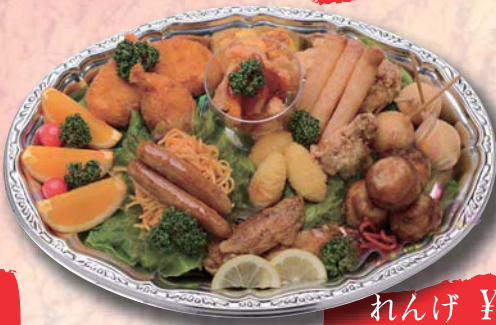
れんげ ¥2,000- 380mm × 265mm