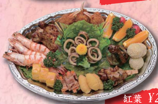
紅葉 ¥2,000- 380mm × 265mm