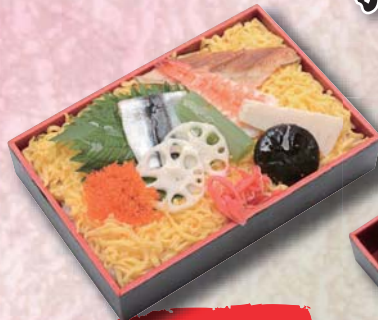
チラン寿司 ¥500- 170mm × 115mm