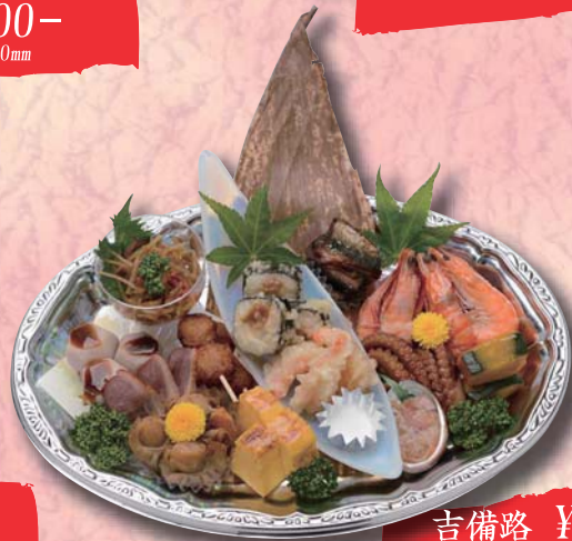
吉備路 ¥2,000- 380mm × 265mm