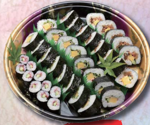
菊 ¥2,500- 365mm × 365mm