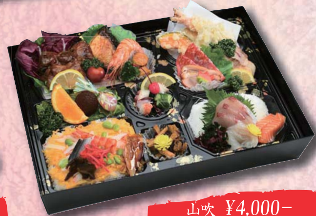
山吹 ¥4,000- 395mm × 280mm