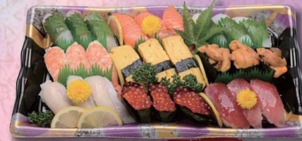
くすのき ¥2,500- 380mm × 220mm