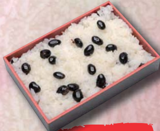
白蒸し ¥600- 170mm × 115mm