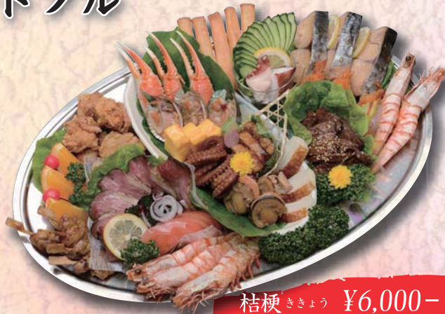
桔梗 ききょう ¥6,000- 510mm × 340mm