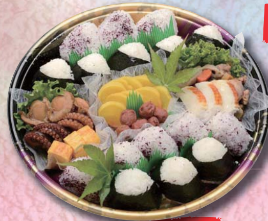
あくら ¥2,500- 365mm × 365mm