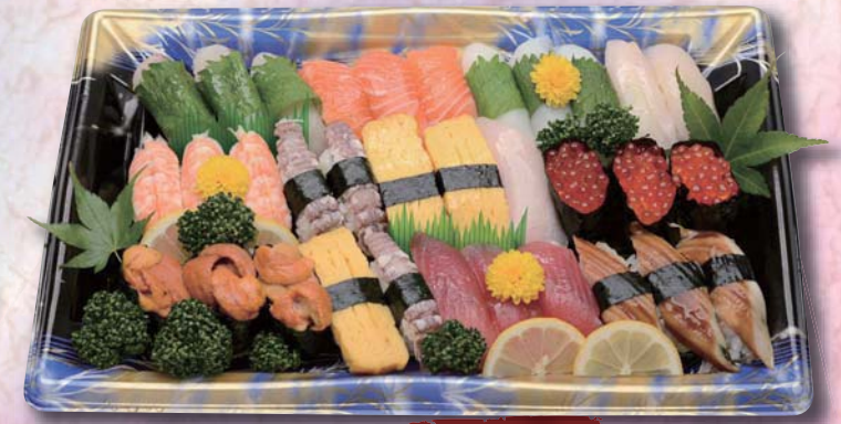
天領 ¥4,000- 400mm × 270mm