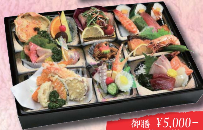
御膳 ¥5,000- 435mm × 310mm