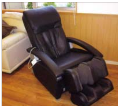
マッサージチェア