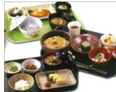
お食事は一例です