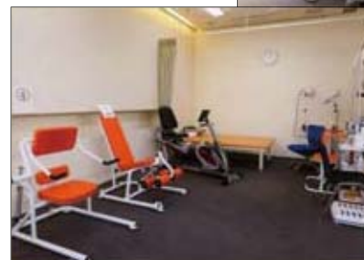
トレーニング ルーム