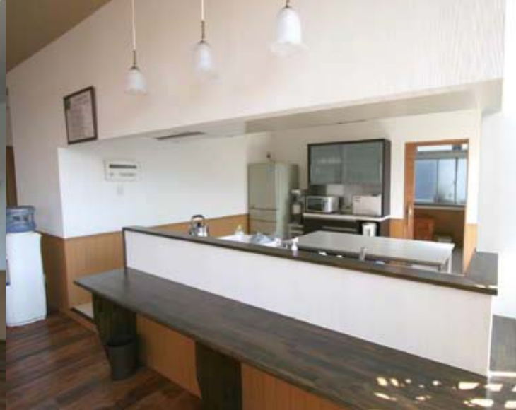
開放的空間のカウンター